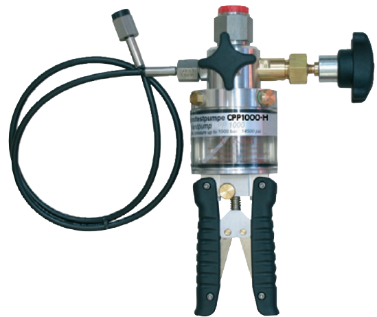
Гидравлический ручной насос CPP1000-H